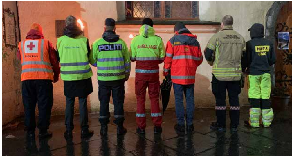
Minnemarkeringa er eit samarbeid mellom ei rekkje aktørar, deriblant Trygg Trafikk.