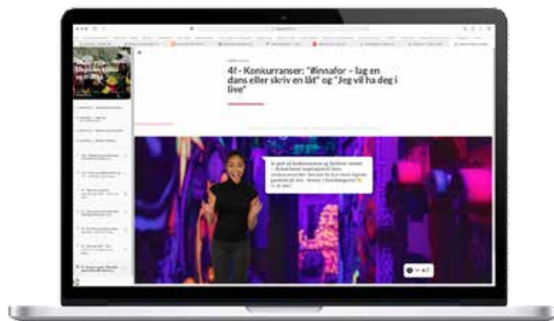
Magasinet Underveis er nå også på nett.

Dei fysiske arrangementa me hadde planlagt – russe-rebusen i Åsane, russearrangementa i Knarvik gjennom TSU og det store arrangementet for nær 3000 russ i Grieghallen – vart dessverre avlyste i 2020. Her vonar me å ha nye, digitale variantar som er moglege å gjennomføra i 2021, uavhengig av om det ikkje er råd å møtast fysisk. Det er også opplagt eit mål å nå ut breiare, slik at me får gode tiltak både i tidlegare Sogn og Fjordane og Hordaland framover. Slik sett utgjer digitale gjennomføringar av tiltak gode moglegheiter for oss.