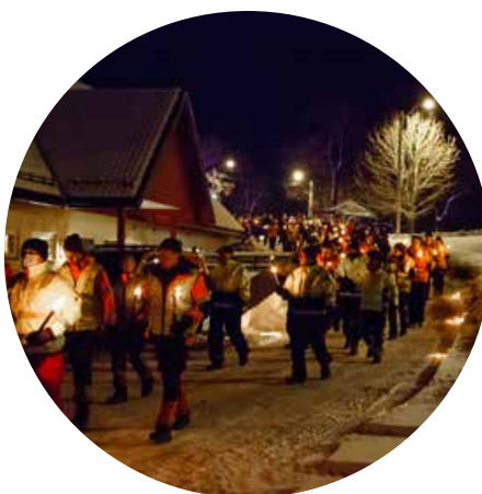
Det ble et fint markering, men med langt færre deltakere på grunn av koronarestriksjoner.

Samferdselsminister Knut Arild Hareide var årets hovedtaler, og Odd Nordstoga sto for den musikalske delen. Arrangementet ble streamet og fikk veldig gode tilbakemeldinger. Det ble et flott innslag på Dagsrevyen og på Kveldsnytt. Arrangementet for 2020 ble et mer kostnads-krevende tiltak enn tidligere, da mye nytt materiell måtte kjøpes inn for å kunne markere hele det nye fylket, og fordi alt ble streamet. Neste års arrangement er planlagt den 2. januar 2022.