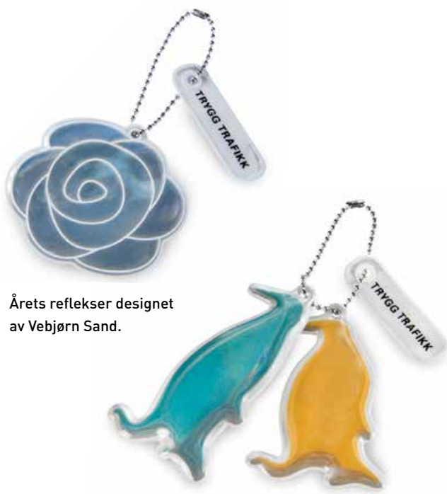
Årets reflekser designet av Vebjørn Sand.