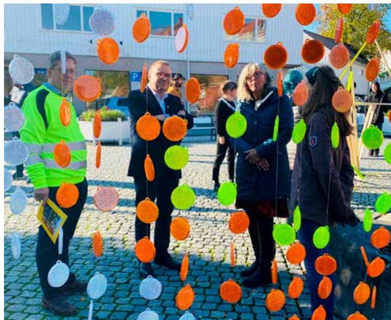
Leder for hovedutvalget for samferdsel i prat med studentene på Kragerø kunstscole.