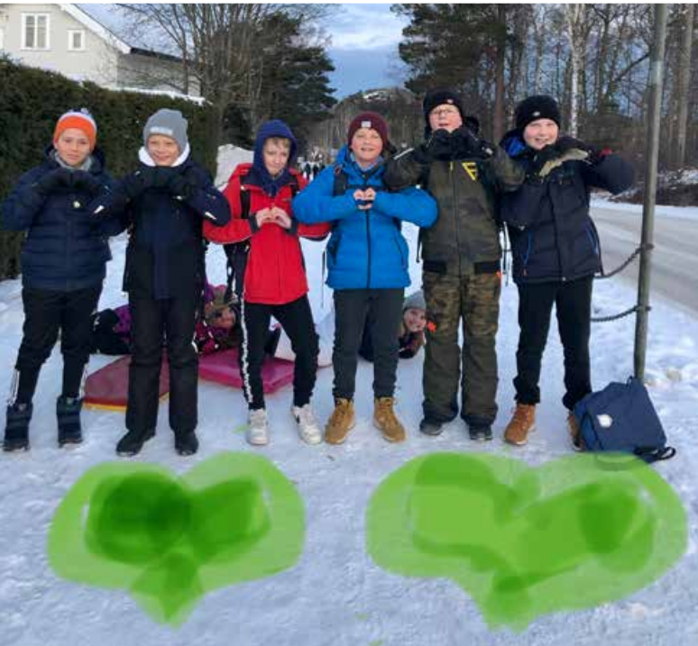
Elevene på Gokstad skole i Sandefjord er opptatt av Hjertesone.

Sykkelopplæring har over mange år stått sentralt i både Vestfold og Telemark.