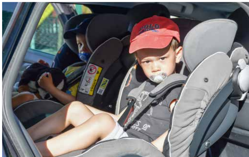
Riktig sikring av barn i bil kan bety forskjellen på liv og død!