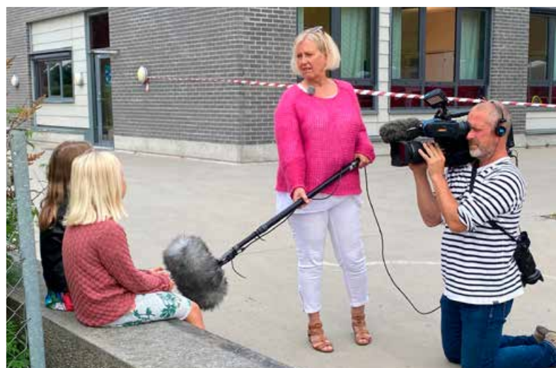
NRK intervjuer skolebarn på Sandeåsen skole om skoleveien og skolestart.

Ville veier og vrangle skilt er et trafikkteater for elever fra 1. til 3. trinn. Teateret tar opp aktuelle trafikkrelaterte tema for denne målgruppen, slik som å krysse vei, oppførsel på bussen og bruk av refleks og bilbelte. 20 barneskoler i Vestfold og Telemark fikk besøk i 2020. Teateret er et flott utgangspunkt for skolene til å jobbe videre med trafikk i