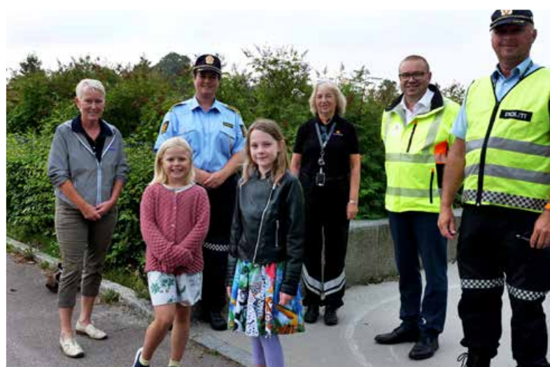
Samarbeidspartnere møter pressen for å snakke om skolestart.