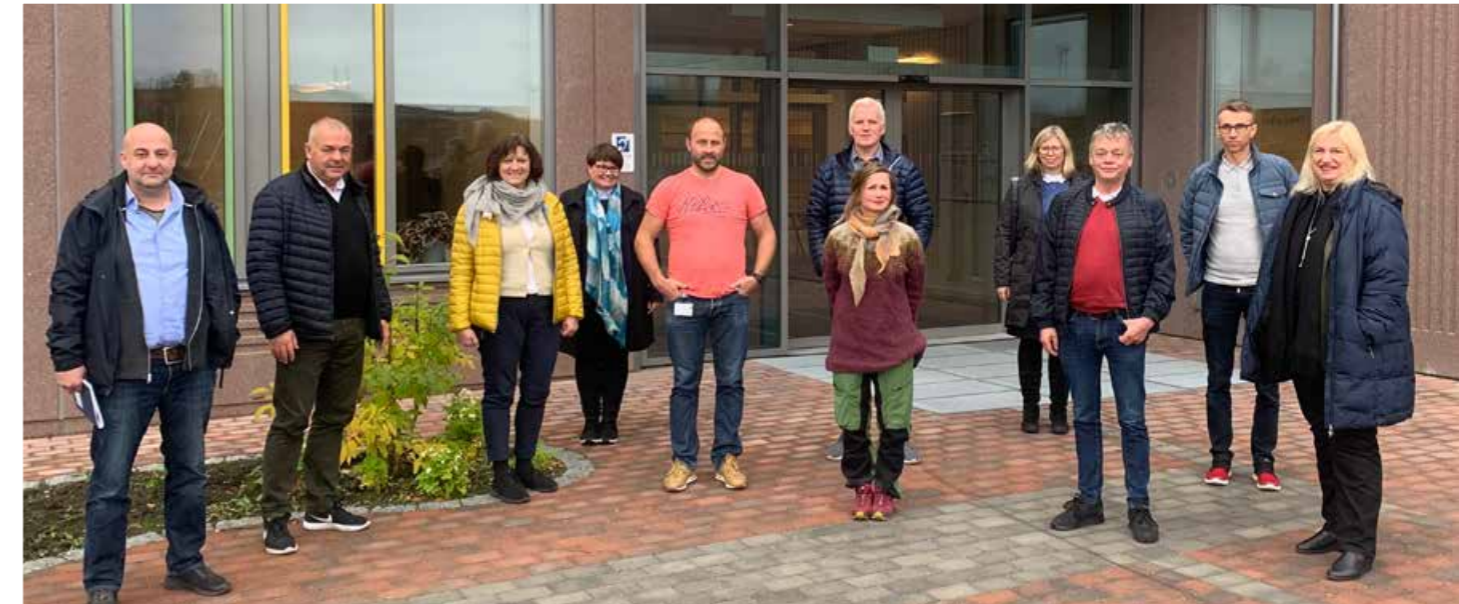
Trafikk sikkerhetsutvalget i Troms og Finnmark befarte skolevei i Kirkenes høsten 2020.