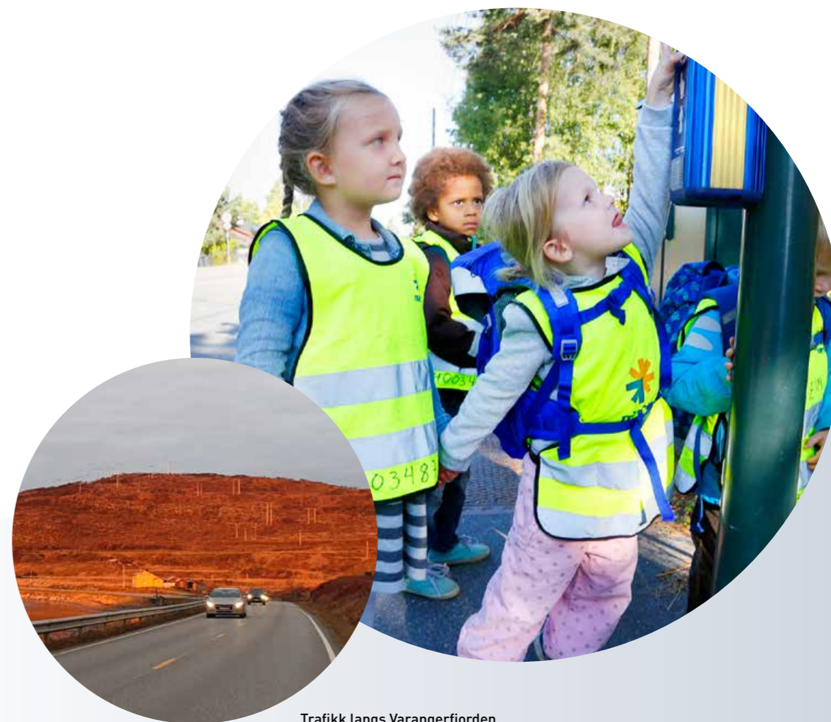
Trafikk langs Varangerfjorden.