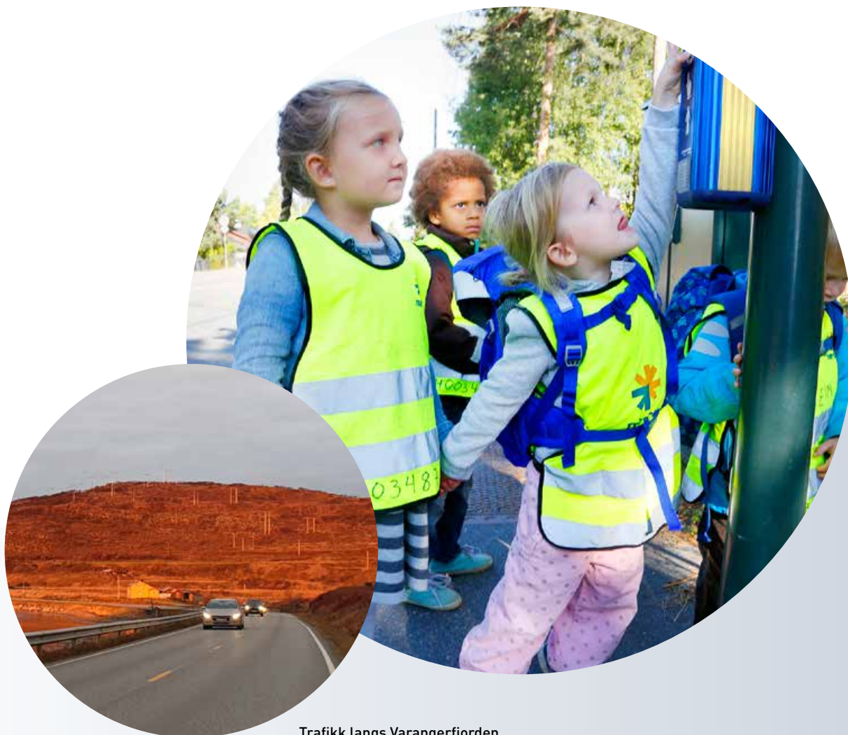
Trafikk langs Varangerfjorden.