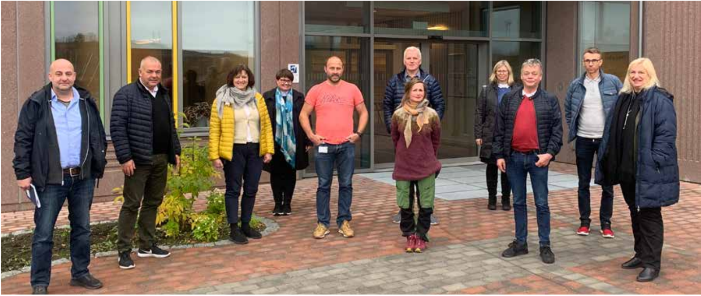
Trafikksikkerhetsutvalget i Troms og Finnmark befarte skolevei i Kirkenes høsten 2020.