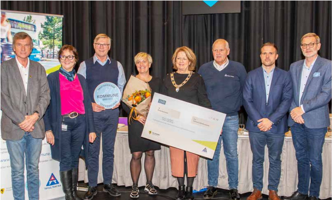
Nome kommune ble godkjent som trafikksikker kommune i oktober.

Politisk ledelse i fylkeskommunen er positive og blir gjerne med på godkjenningsmarkeringen i kommunene, og overrekker kommunen en sjekk på 50 000 kr, som er ment å gå til et trafikksikkerhetstiltak – bidra til å stimulere trafikksikkerhetsarbeidet i kommunen. Trygg Trafikk deler ut godkjenningsskilt til kommunen, barnehager og skoler, som et synlig uttrykk for dem selv og omgivelsene for at de har gjennomført et program for å bli godkjent som trafikksikker kommune, barnehage eller skole, samt spanderer trafikksikker kommunekake. I noen kommuner kommer det skolebarn eller barnehagebarn og underholder med sang.