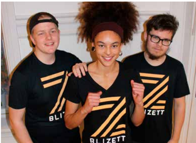
BliZett ambassadører fra Lyk-z & døtre stilte opp som gode hjelpere.