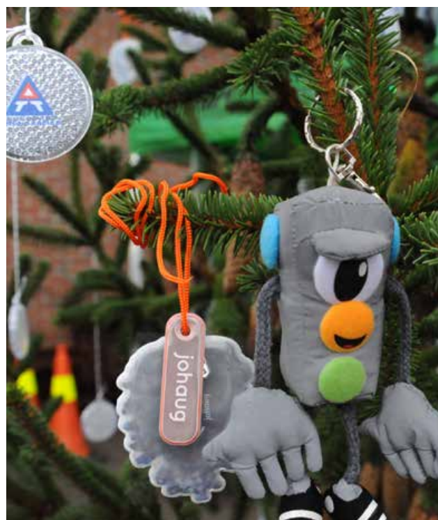
Telemark Skogselskap stilte opp på nasjonal refleksdag i Bø med grantre fullt av ekte kongler, og som ble pyntet med reflekskongler designet av Therese Johaug, og andre reflekser.

Målgruppen for refleksdagen er alle trafikanter, men spesielt voksne over 20 år er en viktig målgruppe fordi de er dårlige refleksbrukere, og de er rollemodeller og forbilder for mange. Det ble delt ut tusenvis av reflekser. Flere organisasjoner og skoler har meldt om at de arrangerer egne refleksaktiviteter knyttet til refleksdagen eller hele refleksdagsuken. I tilknytning til Refleksdagen 2019 innledet vi samarbeid med blant annet Telemark Skogselskap, Telemark Bondelag, Bø Bygdekvinnelag og Fylkeshuset i Skien. I Bø var vi representert utenfor Bøsentret, der Telemark Skogselskap, Telemark Bondelag og Bø Bygdekvinnelag lagde en flott stand med en grantre topp fylt av kongler og med konglere reflekser festet på, sekker med grankongler, traktor med lys som lyste opp refleksene på grantretoppen, og flotte rosemalte sendingskurver med konglere reflekser til Therese Johaug. Dette var et populært