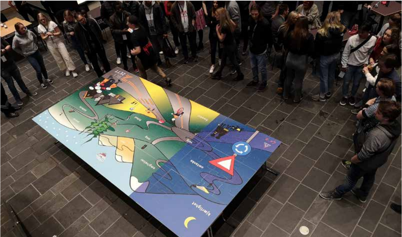
Puslespill med tema trafikk på 2x4 meter. Dette ble lagt av de 200 deltakerne på BliZett konferansen. Dette henger nå på kjøpesenteret Arkaden i Skien og blir sett av mange.

tilskudd til henholdsvis Telemark og Vestfold, og aller helst at det blir en romsligere ramme, slik at vi kan opprettholde den store aktiviteten og aller helst får mulighet til å utvide den. Trygg Trafikk er gode til å bruke pengene «på både siur» og få mye trafiksikkerhet ut av beskjedne midler.