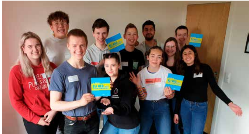
Ungdomsrådet forsøkte å få gjennomført #EDS i Telemark.