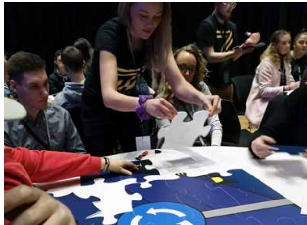
Deltakerne på BliZett puslet sammen med de andre på konferansen et 2x4 meter stort puslespill.

press på seg på mange ulike måter. Ungdom mellom 15 og 24 år er en svært risikoutsatt gruppe, og vi må sørge for å sette dem i stand til å ta vare på seg selv og de rundt seg – lære dem å se konsekvenser av valg.