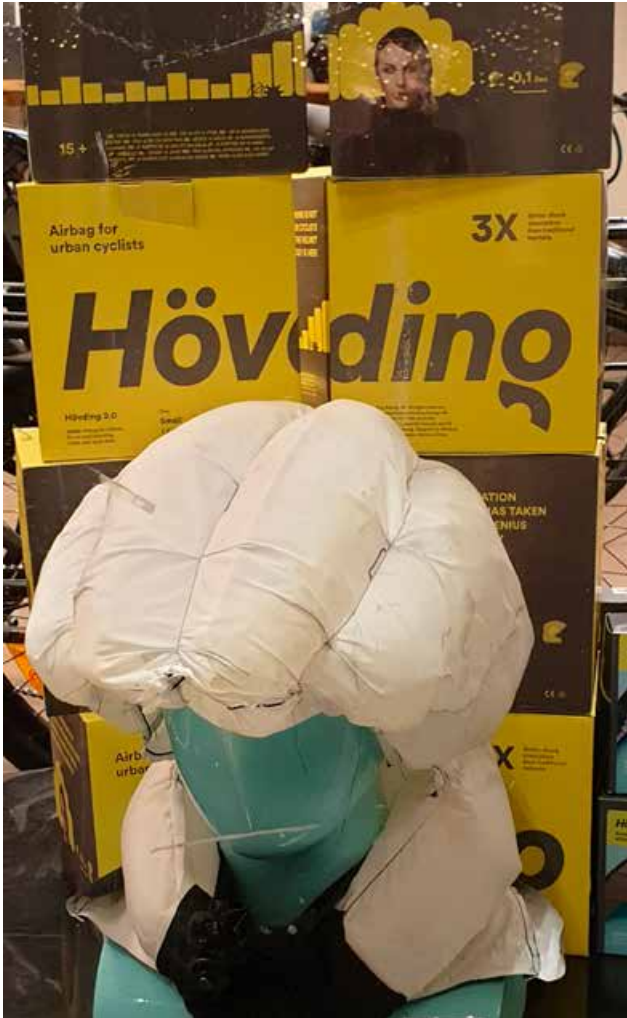
Høvdinghjelm er et godt alternativ for de som ikke vil bruke vanlig sykkelhjelm.