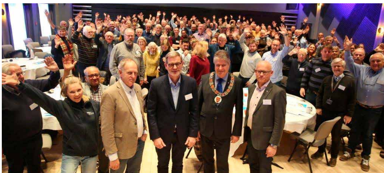
Historiens siste trafikk sikker konferanse i BTV før regionreformen og fylkessammenslåingen fra 2020.

konferansen i Vrådal og på diverse andre møter i regi av Telemark fylkeskommune, samt Trygg Trafikks nasjonale trafikk sikkerhetskonferanse «Nasjonale mål – regionalt ansvar.» Her trekkes linjene fra de nasjonale satsingsområdene til praktiske tiltak i fylkeskommunene og kommunene.