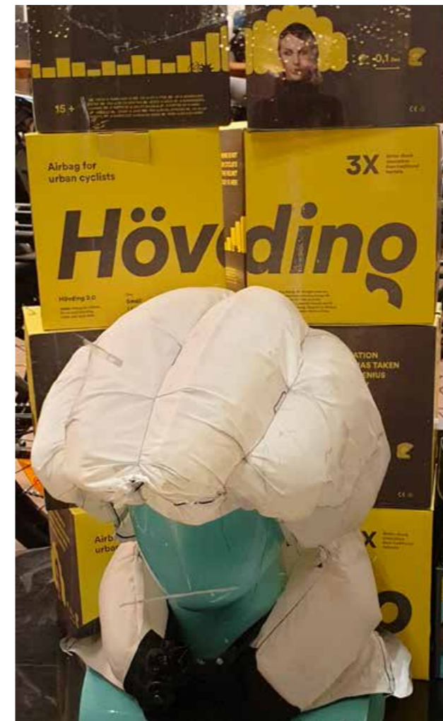
Hövdinghjelm er et godt alternativ for de som ikke vil bruke vanlig sykkelhjelm.

Tellingene foregår utenfor barnehager og skoler, og ser på hvordan barna er sikret i bil. Totalt ble det registrert 3963 barn i alle landets fylker. Resultatet er vektet etter geografi i henhold til offentlig statistikk, slik at totaltallene reflekterer de ulike fylkenes befolkningsstørrelse.