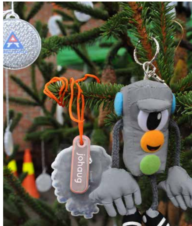
Telemark Skogselskap stilte opp på nasjonal refleksdag i Bø med grantre fullt av ekte kongler, og som ble pyntet med reflekskongler designet av Therese Johaug, og andre reflekser.

Målgruppen for refleksdagen er alle trafikanter, men spesielt voksne over 20 år er en viktig målgruppe fordi de er dårlige refleksbrukere, og de er rollemodeller og forbilder for mange. Det ble delt ut tusenvis av reflekser. Flere organisasjoner og skoler har meldt om at de arrangerer egne refleksaktiviteter knyttet til refleksdagen eller hele refleksdagsuken. I tilknytning til Refleksdagen 2019 innledet vi samarbeid med blant annet Telemark Skogselskap, Telemark Bondelag, Bø Bygdekvinne lag og Fylkeshuset i Skien. I Bø var vi representert utenfor Bø senteret, der Telemark Skogselskap, Telemark Bondelag og Bø Bygdekvinne lag lagde en flott stand med en grantre topp fylt av kongler og med konglereflekser festet på, sekker med grantre kongler, traktor med lys som lyste opp refleksene på grantre toppen, og flotte rosemalte sendingskurver med konglereflekser til Therese Johaug. Dette var et populært