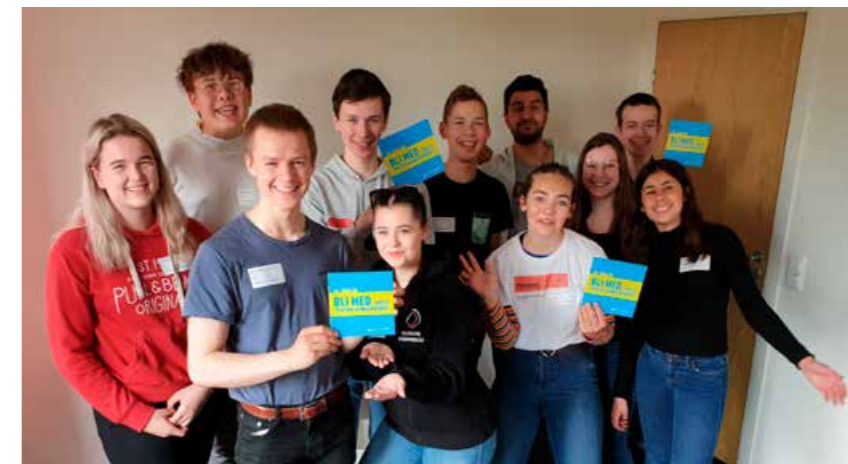
Ungdomsrådet forsøkte å få gjennomført #EDS i Telemark.