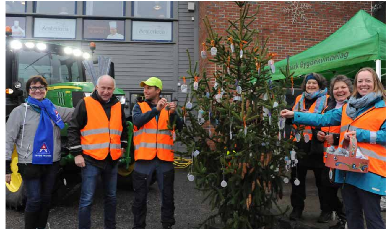
Telemark Skogselskap, Telemark Bondelag og Telemark Bygdekvinne lag stilte opp med refleksstand tilpasset årets refleksdesign, kongle av Therese Johaug.

innslag en mørk og regntung ettermiddag på den nasjonale Refleksdagen i oktober. Det ble folksomt og mye prat om betydningen av refleksbruk med publikum, og det ble delt ut mange reflekser. Bø Blad stilte opp og lagde reportasje.