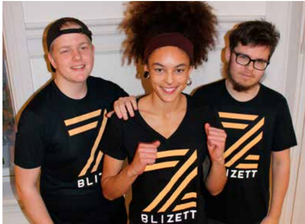
BliZett ambassadører fra Lyk-z & døtre stilte opp som gode hjelpere.