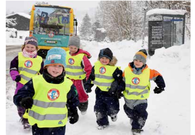
Glade barn i Barnas Trafikkklubb.

møte med kommuner i forbindelse med Trafikk-sikker kommune-konseptet og gjennom FTU-møter i kommunene. Dette har ført til mer kunnskap om Trygg Trafikk og Barnas Trafikkklubb sine tilbud til barnehager. Det er 165 medlemmer fra Telemark i Barnas Trafikkklubb per 1. januar 2020.