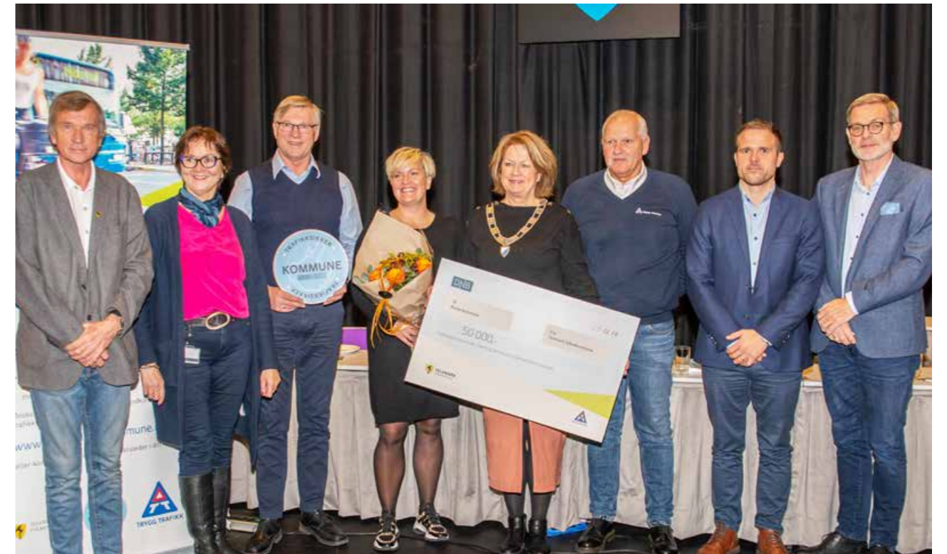
Nome kommune ble godkjent som trafiksikker kommune i oktober.

Det er forankret i Areal- og transportplan for Telemark 2015–2025 at Trygg Trafikks konsept Trafiksikker kommune skal inn i alle kommuner i Telemark innen planperioden er over. Arbeidet med Trafiksikker kommune lokalt går ut på å informere, inspirere og motivere kommuner til å bli godkjente trafiksikre kommuner. Det innledes først med et møte med ordfører og rådmann og rådmannens ledergruppe. Det skrives en intensjonsavtale der det framkommer en dato fram i tid for når kommunen går inn for å lande prosessen og fylle kriteriene for en endelig godkjenning fra Trygg Trafikk lokalt og sentralt. Trygg Trafikk i Telemark følger opp med veiledning og oppfølging i kommunen. I noen kommuner er det ønske om å informere kommunestyremøtet eller ha HMS-kurs eller barnehagekurs i denne prosessen – dette for å bevisstgjøre og øke kompetansen til deres medarbeidere og det politiske miljøet om trafiksikkerhet og hva det betyr å være en trafiksikker kommune der alle må bidra til å nå mål og redusere skade og død i trafikken. Til slutt er det godkjeningsmøte med kommunens administrative og politiske ledelse, der Trygg Trafikks sentrale representanter for konseptet gjennomgår enhet for enhet i kommunen opp mot kriteriene som de har svart ut. Eventuelt kommer det til uttrykk mulige forbedringspunkter.