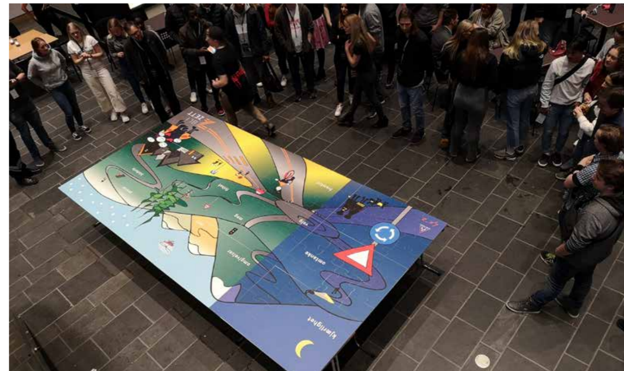
Puslespillet med tema trafikk på 2x4 meter. Dette ble lagt av de 200 deltakerne på BliZett konferansen. Dette henger nå på kjøpesenteret Arkaden i Skien og blir sett av mange.

tilskudd til henholdsvis Telemark og Vestfold, og aller helst at det blir en romsligere ramme, slik at vi kan opprettholde den store aktiviteten og aller helst får mulighet til å utvide den. Trygg Trafikk er gode til å bruke pengene «på bære siur» og få mye trafikksikkerhet ut av beskjedne midler.