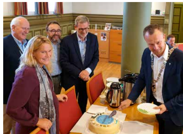
Skien kommune med sine 55.000 innbyggere ble godkjent som ts godkjent kommune i september. Dette ble feiret med kake.

Kommuner og fylkeskommuner har et viktig ansvar for innbyggernes trafiksikkerhet, blant annet som veieier, skoleeier og arbeidsgiver. Trafiksikkerhet er et tverrfaglig område, og samordning av arbeidet er en utfordring. Trafiksikker kommune og Trafiksikker fylkeskommune er godkjeningsordninger utviklet av Trygg Trafikk. Kriteriene bygger på eksisterende lovverk og er en hjelp for kommuner og fylkeskommuner til å systematisere trafiksikkerhetsarbeidet på tvers av sektorer. Folkehelsearbeidet er sentralt i kommuner og fylker, og det er naturlig å knytte trafiksikkerhet til det ulykkesforebyggende helsearbeidet.