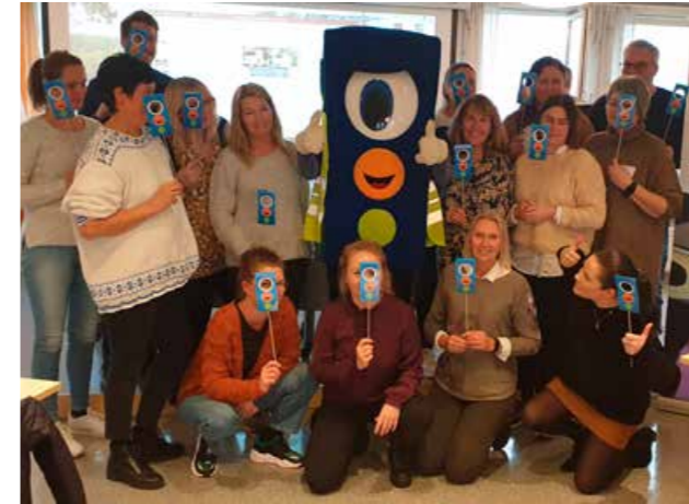
Trafikkopplæringskurs for barnehageansatte på Fylkeshuset i Skien.