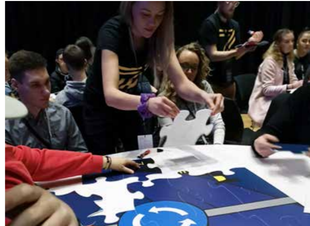
Deltakerne på BliZett puslet sammen med de andre på konferansen et 2x4 meter stort puslespill.

press på seg på mange ulike måter. Ungdom mellom 15 og 24 år er en svært risikoutsatt gruppe, og vi må sørge for å sette dem i stand til å ta vare på seg selv og de rundt seg – lære dem å se konsekvenser av valg.