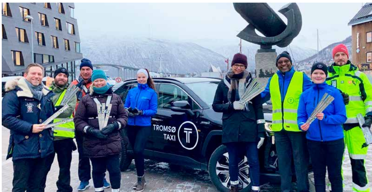
▲ Trygg Trafikk sammen med Tromsø taxi og Troms og Finnmark fylkeskommune delte ut reflekser i Tromsø sentrum.

fart og rus. Kommuner har fått informasjon om det digitale HMS-kurset vårt, og vi har bidratt med opplæring under Bolystuka i regi av Finnmark fotballkrets. Før jul presenterte vi historieboka Tiden Trenger Trygg Trafikk ved Universitetsbiblioteket i Tromsø.