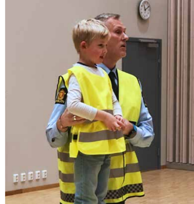
Refleksvestutdeling til 1.- og 5.-klassinger i fylket. Her ved politiet, som deler ut vestene på skolene.