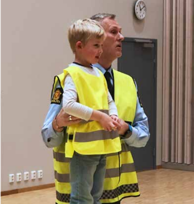
Refleksvestutdeling til 1.- og 5.-klassinger i fylket. Her ved politiet, som deler ut vestene på skolene.