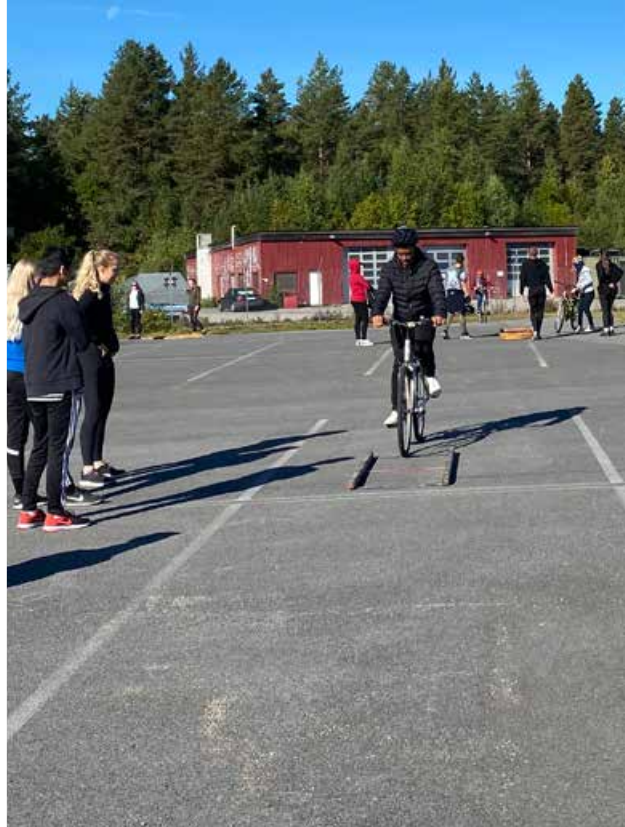
På Terningen arrangerte vi trafikkdag på to hjul.

Norges Cykleforbund, Syklistforeningen, NAF og Trygg Trafikk.