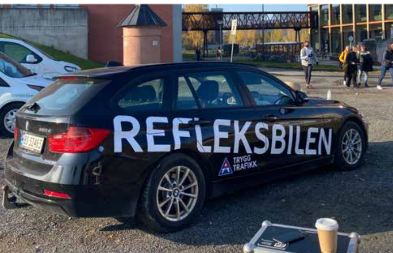
«Reflex yourself» kjørte fylket rundt på Refleksens dag.