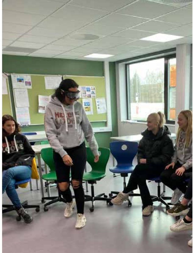
Trafiksikkerhetsdag på ELVIS.

Vi vet også at mange skoler tilbyr valgfaget trafikk med muligheter for å ta trafikalt grunnkurs. Dette når ikke alle elevene i 10. klasse, og det ivaretas av lærere med spesiell kompetanse. Opplegget vi tilbyr her, skal ivaretas av