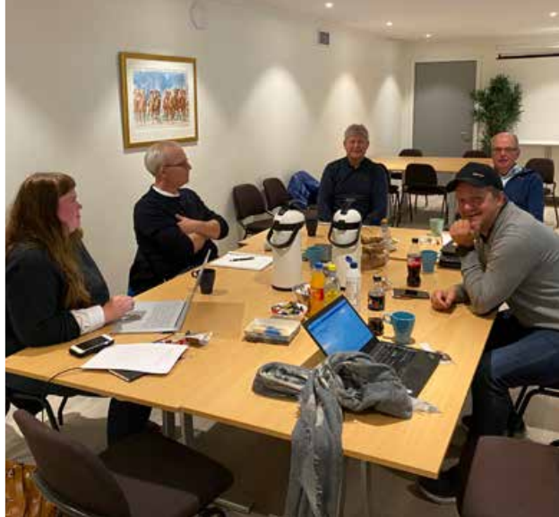
Samspelet mellom rytter og fører av bil er tema når prosjektgruppen møtes.