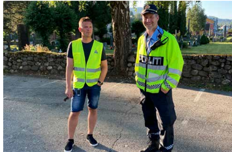
Et nytt kull med førsteklassinger var på vei til skolen, og Trygg Trafikk, FTU og politiet ønsket bilstenes oppmerksomhet på trafikksikker skolestart.

ben er et gratis tilbud for foreldre og barn, barnehager og skoler. Trygg Trafikk legger forholdene til rette og lager pedagogiske verktøy til bruk for målgruppen. Alt tidligere materiell, tilbake til oppstarten av Barnas Trafikklubb i 1966, er nå digitalisert og ligger lett tilgjengelig for alle på Trygg Trafikk sine nettsider. Vi har fremmet Barnas Trafikklubb på trafikkurset for barnehagelærerstudentene samt i møter og samtaler med kommuner i tilknytning til Trafikksikker kommune, gjennom fylkets trafikksikkerhetsutvalg (FTU) og i media. Trafikken på sidene til Barnas Trafikklubb har hatt en markant opp-gang siden lanseringen av de nye sidene.