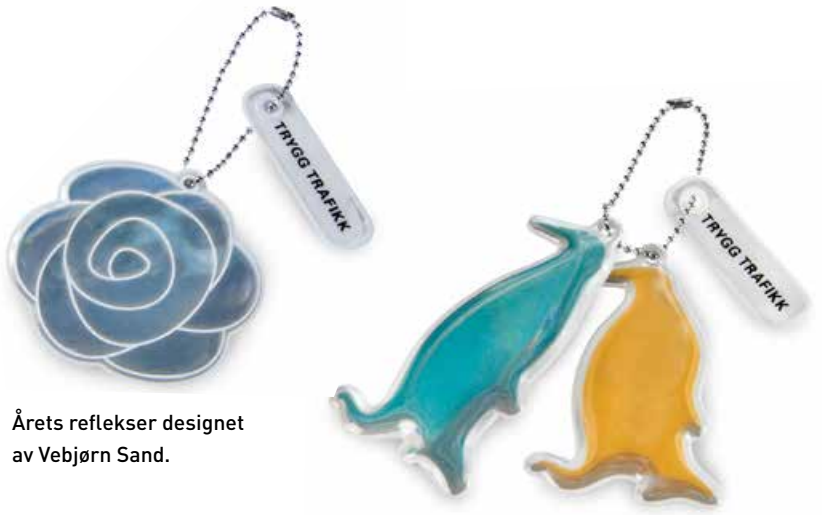
Årets reflekser designet av Vebjørn Sand.