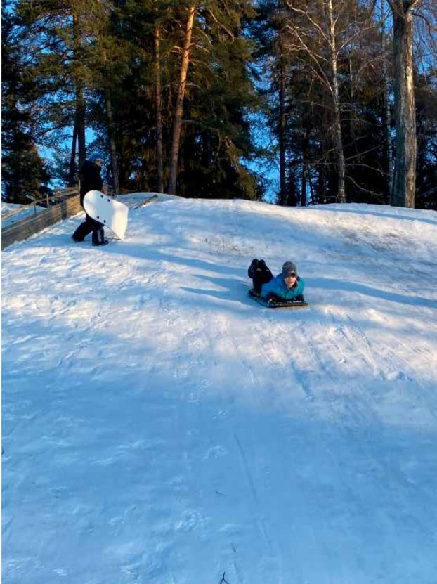
Det er viktig at barn akker på et trygt sted borte fra trafikken.