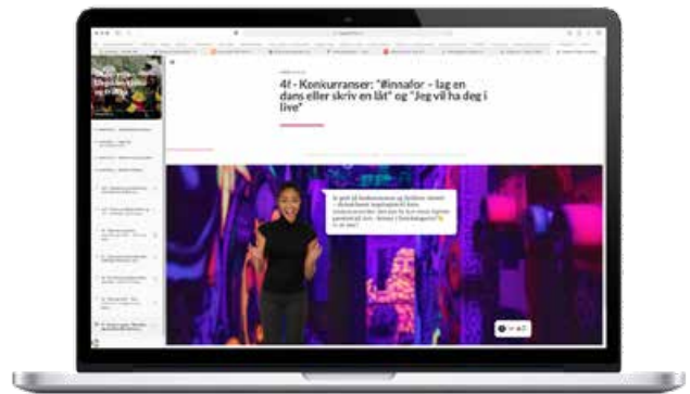
Magasinet Underveis er nå også på nett.