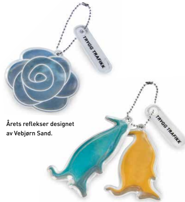
Årets reflekser designet av Vebjørn Sand.