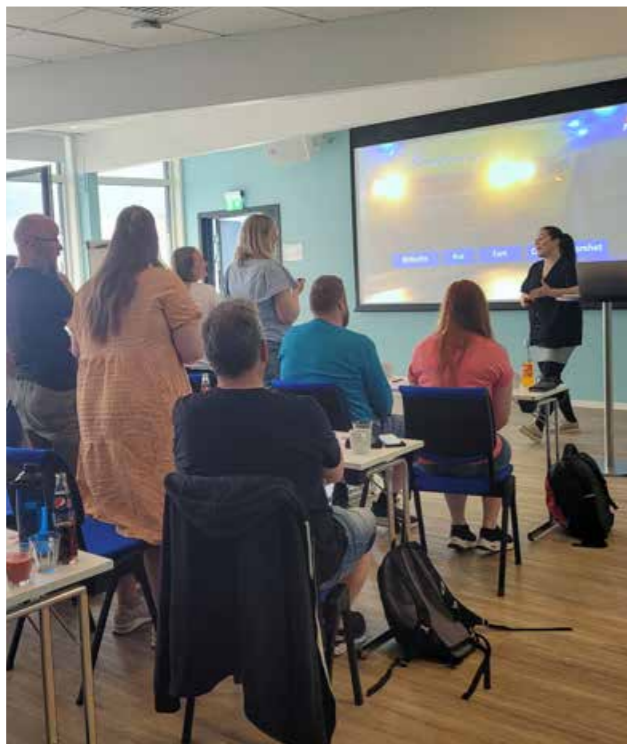
▲ Barnehageansatte fra Harstad og Tjeldsund på kurs våren 2022.