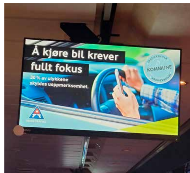
▲ Vi har hatt søkelys på oppmerksomhet i trafikken i år. Her vises kampanje på fylkeskommunale skjermer på hurtigbåten mellom Tromsø og Harstad.