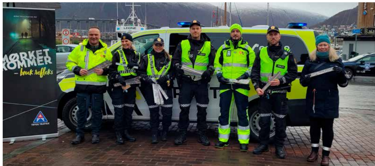
▲ Årets refleksdag ble markert i Tromsø sentrum sammen med Troms og Finnmark fylkeskommune, UP og lokalt politi.