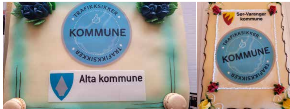
◀ Høsten 2022 ble Sør-Varanger godkjent og Alta regodkjent som Trafikksikker kommune.