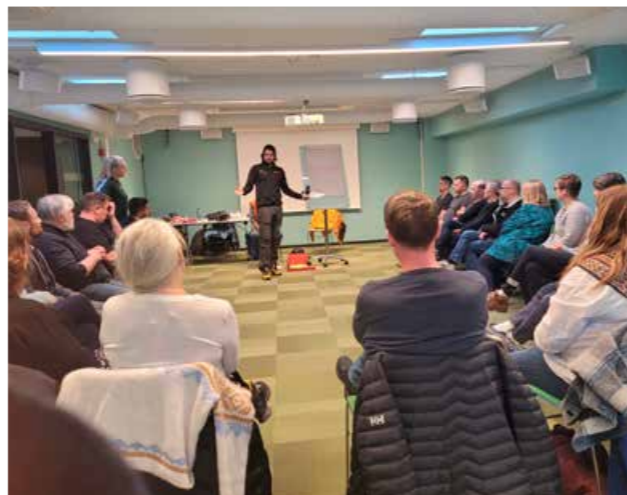
▲ Høsten 2022 gjennomførte vi nettverksmøter for lærere som underviser i valgfaget trafikk på ungdomstrinnet i hele fylket. Norsk folkehjelp gjennomførte førstehjelpskurs.