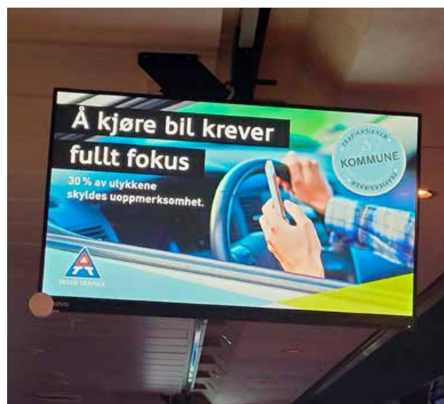
▲ Vi har hatt søkelys på oppmerksomhet i trafikken i år. Her vises kampanje på fylkeskommunale skjermer på hurtigbåten mellom Tromsø og Harstad.