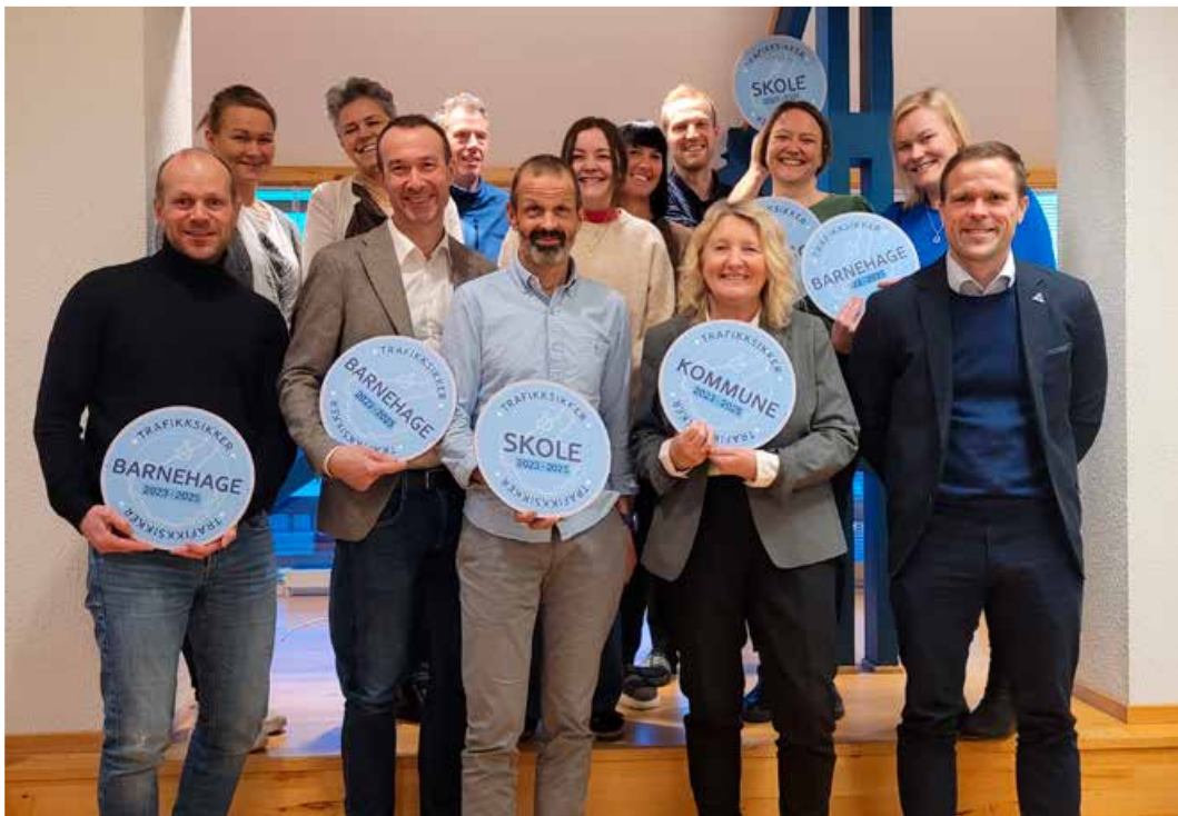
◀ Ordfører og ledere i Skjervøy kommune samlet sammen med Troms og Finnmark fylkeskommune og Trygg Trafikk i forbindelse med at de ble godkjent som Trafikksikker kommune rett før jul i 2022.