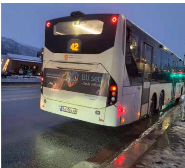
▲ Viktig budskap bak på bussene høsten 2022.