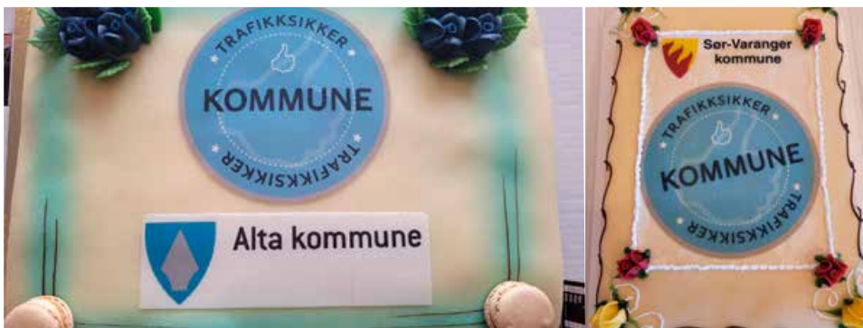
◀ Høsten 2022 ble Sør-Varanger godkjent og Alta regodkjent som Trafikksikker kommune.