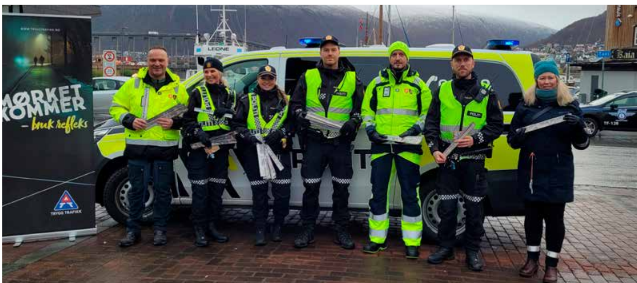
▲ Årets refleksdag ble markert i Tromsø sentrum sammen med Troms og Finnmark fylkeskommune, UP og lokalt politi.