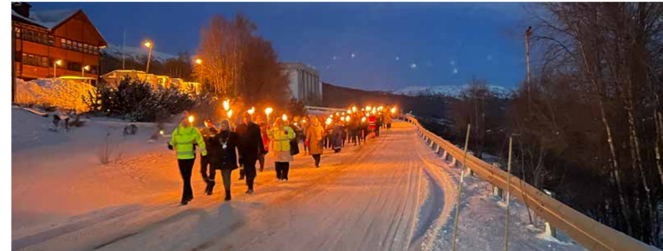
▲ Minnemarkering for 2022 ble holdt på Lesja.

På nasjonalt nivå finansieres Trygg Trafikk over statsbudsjettet og gjennom frie midler og prosjektkjøp fra Finans Norge og forsikringsselskapene. Lokale aktiviteter rundt om i landet finansieres gjennom fylkenes tilskudd.