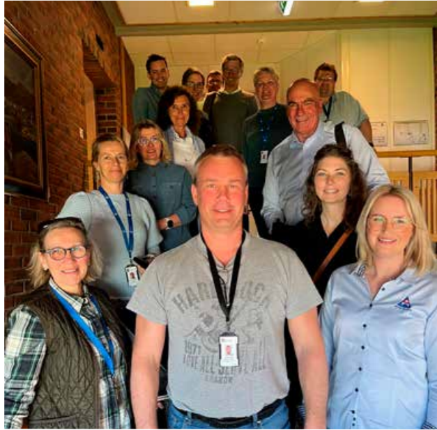
▲ Grimstad kommune ble regodkjent i 2022. Kommunen har god tradisjon for godt samarbeid med Trygg Trafikk, og var den første kommunen som ble godkjent i fylket.