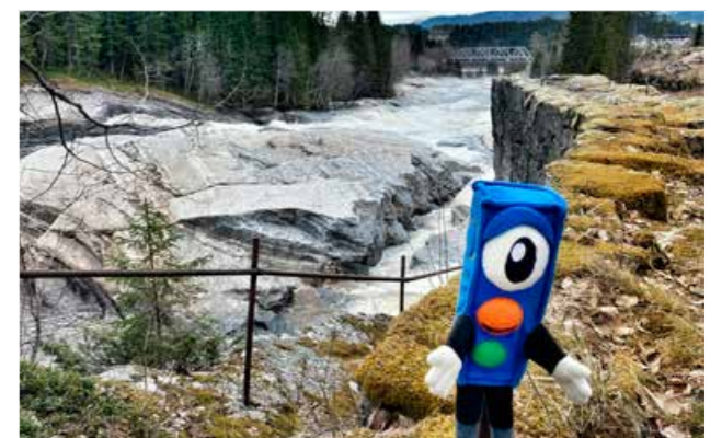
Lysen fra Barnas Trafikkklubb var med rundt i Trøndelag i sommer. Her er han på besøk i Grong med Tømmeråsfossen og jernbanebrua i bakgrunnen.

var gode, og refleksjakten skapte stort engasjement både hos elever og lærere. Flere klasser integrerte den store refleksjakten i andre fag, for eksempel matematikk (lagde statistikk m.m.).