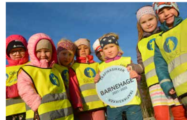
Stolte barn fra Egga barnehage i Meråker viser fram skiltet de har fått.

I år fikk Otterøy oppvekstsenter besøk av alle bidrags-