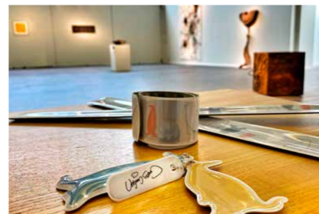
Vebjørn Sand-refleksene måtte selvfølgelig deles ut ved kunstlokaler i fylket. Dette ble svært godt mottatt, og både barn og voksne fikk reflekser designet av den populære kunstneren.

Trygg Trafikk samarbeider med mange aktører i arbeidet