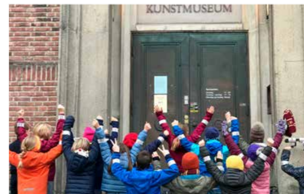
Det var stor deltakelse på årets refleksjakt, med hele 491 elever fra hele fylket. Leka skole gikk av med seieren og vant hovedpremien.

ytterne. Trygg Trafikk holdt foredrag om refleks, hjelm, sikring i bil med mer, og spesielt eggdemonstrasjonen var populær blant barna. Det har i tillegg blitt sendt ut mange tusen refleksjer til barnehager, skoler med flere i hele fylket.