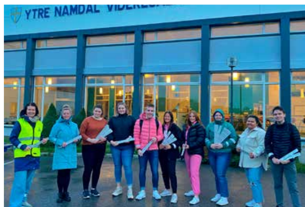
Rektor, lærere og elever ved Ytre Namdal videregående skole på Rørvik delte ut reflekser sammen med Trygg Trafikk på årets refleksdag.

Selve Refleksdagen ble også i år markert på ulike arenaer i fylket. Ytre Namdal videregående skole på Rørvik fikk besøk av Trygg Trafikk, og sammen med rektor, lærere og elever ved skolen ble det delt ut reflekser til alle elever og ansatte. Det var mange smil å få tidlig på morgenen, og ungdommene lovt å bruke refleksene de fikk utdelt. Trygg Trafikk og russestyret hadde også en god samtale om det å tenke trafikkforebygging både før, under og etter russetiden.