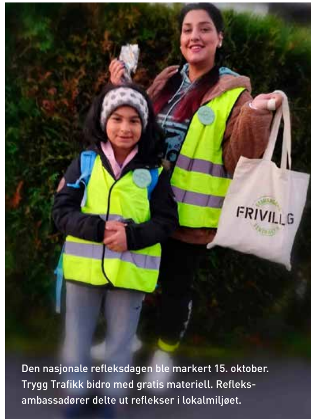
Den nasjonale refleksdagen ble markert 15. oktober. Trygg Trafikk bidro med gratis materiell. Refleksambassadører delte ut refleksmerker i lokalmiljøet.

materiell til bruk i skolen for å ta opp viktigheten av sykkelhjelmer. Dette tas opp som tema for elevene som besøker Sykkelgården på Sandnes og ved etablering av nye hjertesoneskoler.