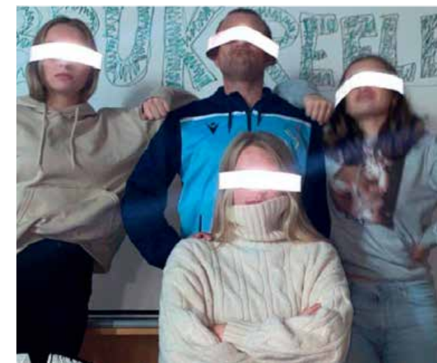
15 videregående skoler i fylket har konkurrert om 10 000 kroner til elevrådet. Skeisvang videregående skole var en av vinnerne.