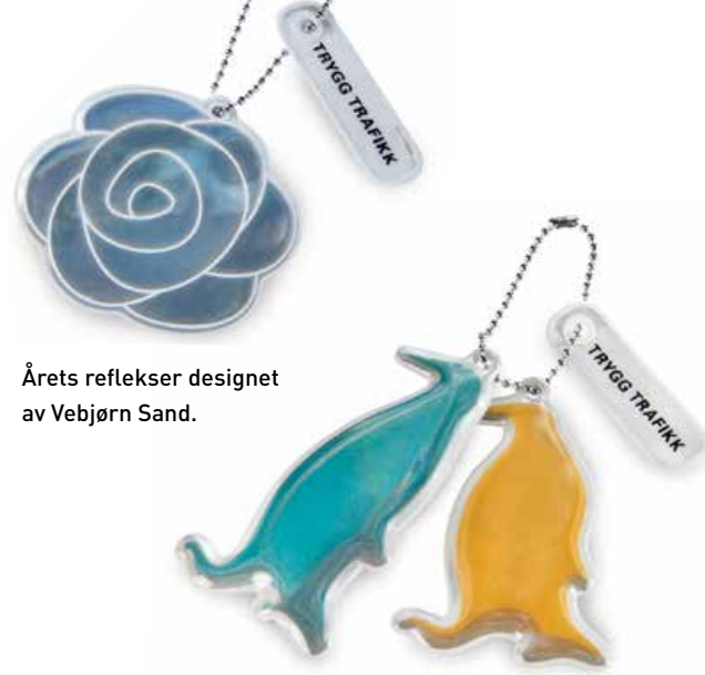
Årets reflekser designet av Vebjørn Sand.