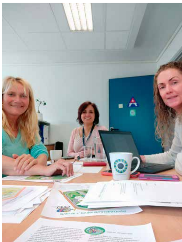
Vi begynte med hjemmekontor 12. mars. Det ble mye digital virksomhet. Arbeidsdagen gikk rundt på Teams- og Zoom-møter. 18. mai møttes vi igjen på kontoret.