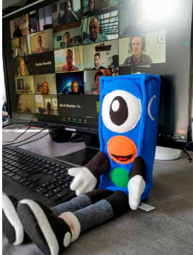
Vi møtes som aldri før – på nett. Det kan være krevende, men også svært effektivt.

Kampanjemateriell om sikring av barn i bil og brosjyre på flere språk ble også avlevert til frivilligsentralene. 15 frivilligsentraler har avtale med Trygg Trafikk om å gjennomføre tiltak for trafikksikkerhet for utsatte grupper.