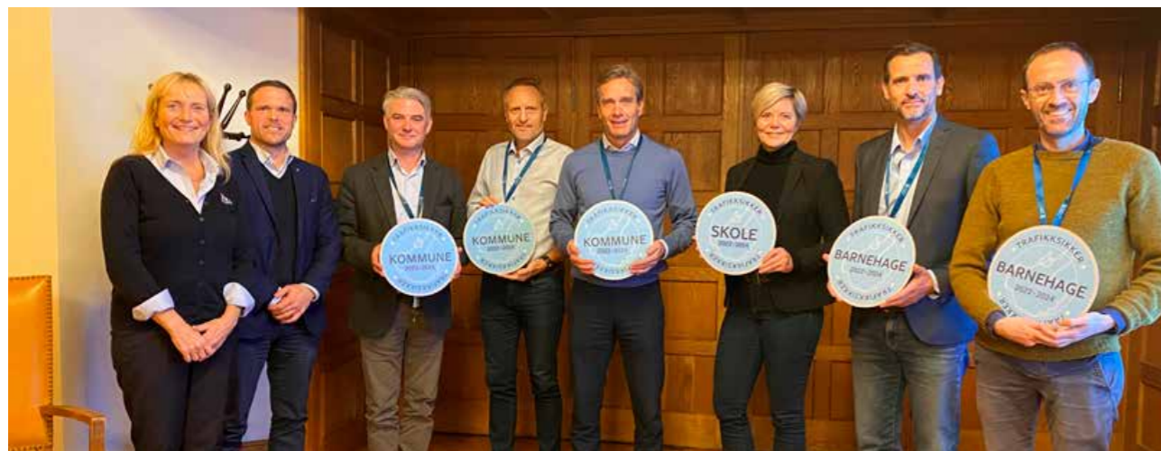
▲ Godkjenningssmøte med Haugesund kommune.

Bjerkreim, Strand og Gjesdal, og fulgte opp kommunene underveis i prosessen. Hå, Gjesdal og Haugesund ble godkjent, og Sauda og Sandnes er godkjent. Det ble også holdt et felles Teams-møte for alle kommunene som er i prosess. Planen for oppfølging i 2022 ble lagt i samarbeid med hver enkelt kommune.