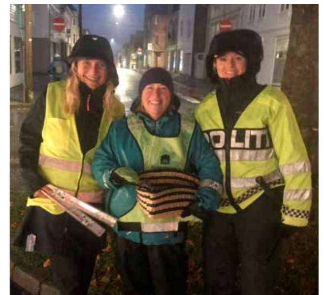
▲ Haugesund kommune delte ut reflekser sammen med politiet og Trygg Trafikk, Refleksdagen 2021.

Resultatet fra Trygg Trafikks årlige refleksstilling viser generelt en økning i bruken av refleks i 2021 sammenlignet med året før. Rundt 50 % av rogalendingene hadde på refleks når de var ute og gikk langs veiene i mørket i 2021, og dette er en økning fra 44 % i 2020. For hele landet viser tellingene i 2021 at 46 % bruker refleks, så Rogaland ligger litt over landsgjennomsnittet.