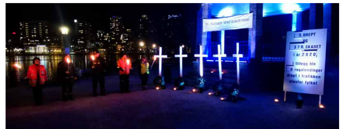
▲ Minnemarkering i Stavanger for trafikkofrene som ble drept eller skadd i Rogaland i 2021.

Trygg Trafikk koordinerte også markeringen av Trafikk ofrenes dag i samarbeid med Statens vegvesen, fylkeskommunen, nødetatene, biskopen og en rekke aktører. Den årlige markeringen ble nedskalert i 2021 på grunn av smittesituasjonen.