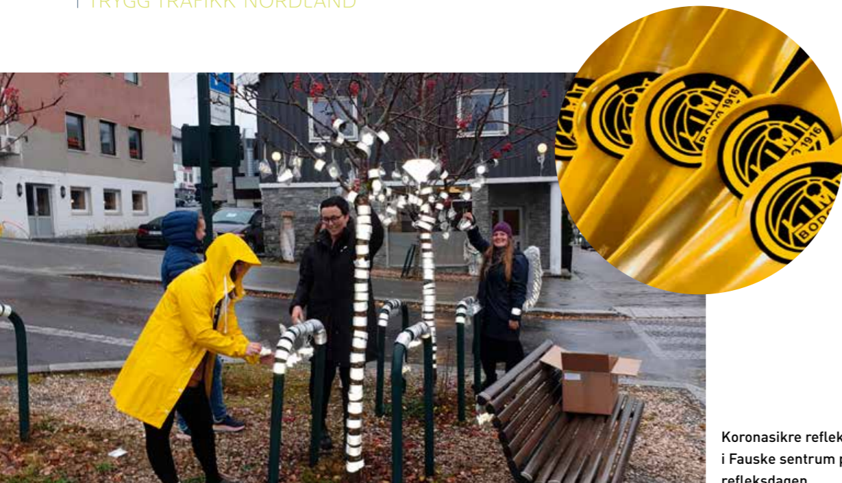
Koronasikre reflekstre i Fauske sentrum på refleksdagen.