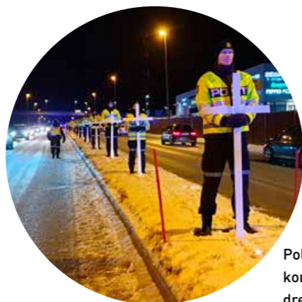
Politistudentene holdt et kors for hver av de trafikk-drepte i Nordland i 2019.

Vegvesenet, Røde Kors, Kirken, begravellesbyråer, politi-studentene og andre. 16 kors og et trettitalls fakler markerte de omkomne og hardt skadde i fylket. Etter samlingen på veien var det appeller og musikk for framtmøtte på Hunstad kultursenter, med mulighet til å tenne lys og ha en stille stund i Hunstad kirke vegg i vegg.