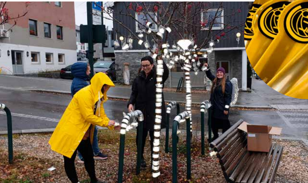
Koronasikre reflekstre i Fauske sentrum på refleksdagen.