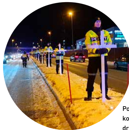
Politistudentene holdt et kors for hver av de trafikk-drepte i Nordland i 2019.

Vegvesenet, Røde Kors, Kirken, begravelsesbyråer, politistudentene og andre. 16 kors og et trettitalls fakler markerte de omkomne og hardt skadde i fylket. Etter samlingen på veien var det appeller og musikk for fram møtte på Hunstad kultursenter, med mulighet til å tenne lys og ha en stille stund i Hunstad kirke vegg i vegg.