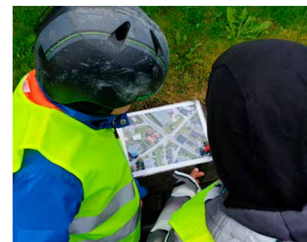
▲ Kurset «Barn, oppmerksomhet og sykling» introduserte lærere og elever til en litt annen form for trafikkopplæring på sykkel.

I Nordland har vi hatt søkelys på å få flest mulig barnehager og småskoler til å ta i bruk Barnas Trafikkklubb.