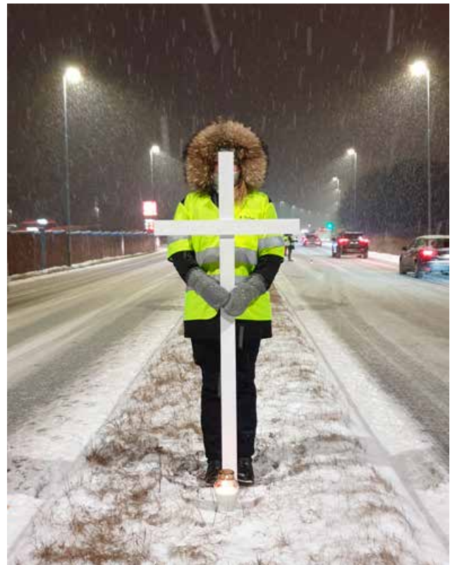
▲ Markering av verdens minnedag for trafikkofre, november 2021.

Etter oppstillingen på veien var det fakkeltog til Hunstad kirke, hvor det var appeller, musikkinnslag og bevertning.