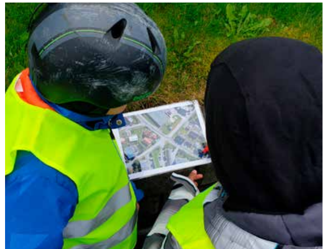
▲ Kurset «Barn, oppmerksomhet og sykling» introduserte lærere og elever til en litt annen form for trafikkopplæring på sykkel.

I Nordland har vi hatt søkelys på å få flest mulig barnehager og småskoler til å ta i bruk Barnas Trafikkklubb.