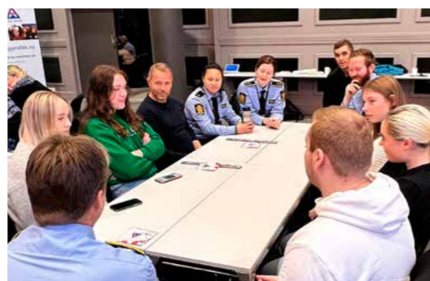
▲ Dagseminar for russestyre og elevråd, politikontakter i samtale med elever.