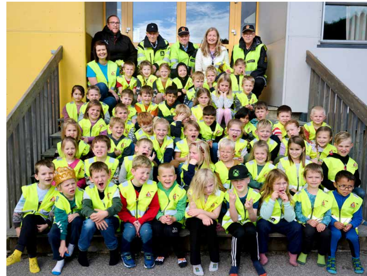
▲ Fornøyde 1.klassinger etter å ha mottatt refleksvester.