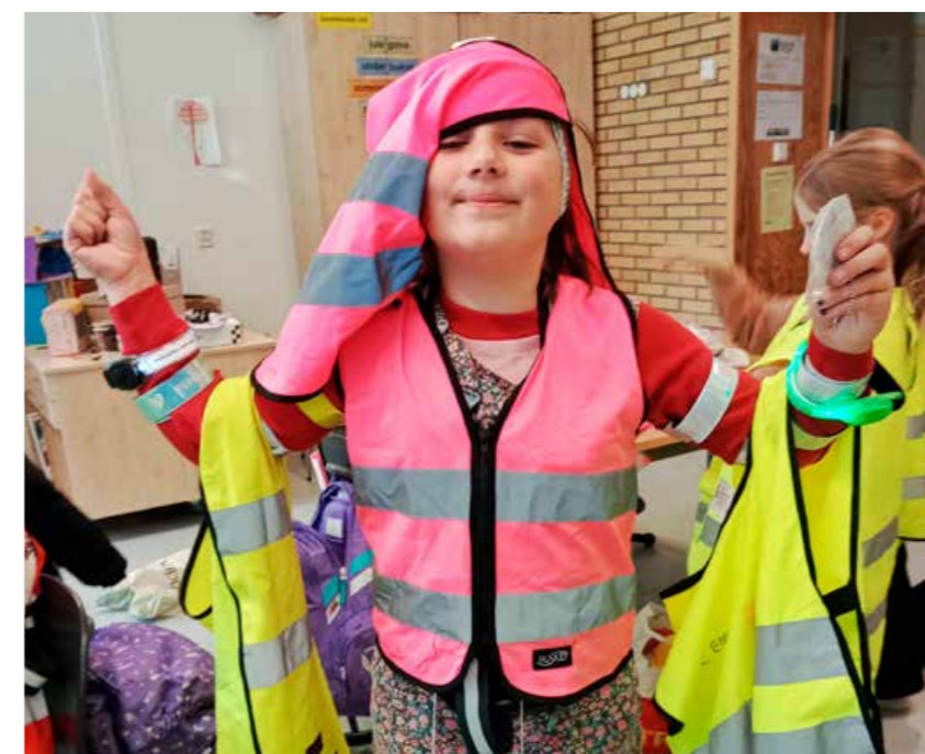
◀ Fornøyd elev etter god innsats i refleksjakten.

Vi gjennomførte også reflekskonkurranse for ungdomsskoler i 2022. Der ble det tre vinnere av hovedpremien, som var gavekort til klassen. Fagerhaug kristne skole vant med to bidrag, #Vises og «Liten tid for å redde et liv».