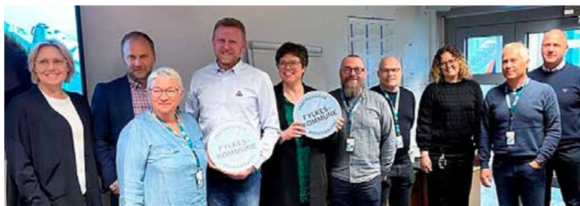
◀ Godkjenningsordningene Trafikksikker kommune og Trafikksikker fylkeskommune er viktige verktøy i vår - med kommuner og med Trøndelag fylkeskommune. I 2022 ble Trøndelag fylkeskommune godkjent etter en god og grundig prosess som involverte alle sektorer og nivåer i fylkeskommunen.

Trygg Trafikk er en pådriver for at myndighetene prioriterer trafikksikkerhet i alle relevante prosesser og planer. Vi initierer og følger opp arbeidet med Trafikksikker kommune og Trafikksikker fylkeskommune. Vi bidrar til tverrfaglighet i kommunale og regionale planer og at disse henger godt sammen med nasjonale mål.