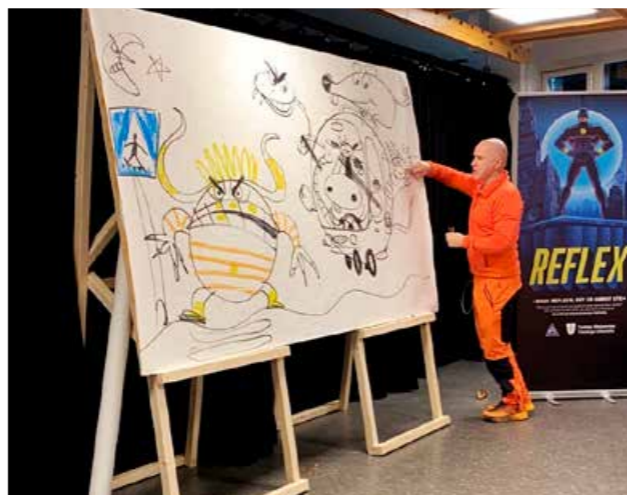
▲ Barn og unge er en viktig målgruppe, og Øisteins blyant er et eksempel på en samarbeidspartner som gjør at vi treffer de unge med de rette pedagogiske verktøyene.

Vi samarbeider med SINTEF om prosjektet Barn, oppmerksomhet og sykling (BOS) når det gjelder barns risikovurdering i trafikken, og med Nord universitet med tanke på ny teknologi i bil og oppmerksomhetsfordeling som bilfører. Vi har gjennomført undervisning over to dager for trafikklærerstudenter på Nord universitet om yrkesstolthet, ulykkesstatistikk og risikofaktorer og informert om Trygg Trafikk sitt arbeid. Dette bidrar til å øke kunnskapen til studentene om ulike atferdsrettede tiltak, og til at trafikklærerne blir bevisste på sin viktige rolle i trafikksikkerhetsarbeidet.