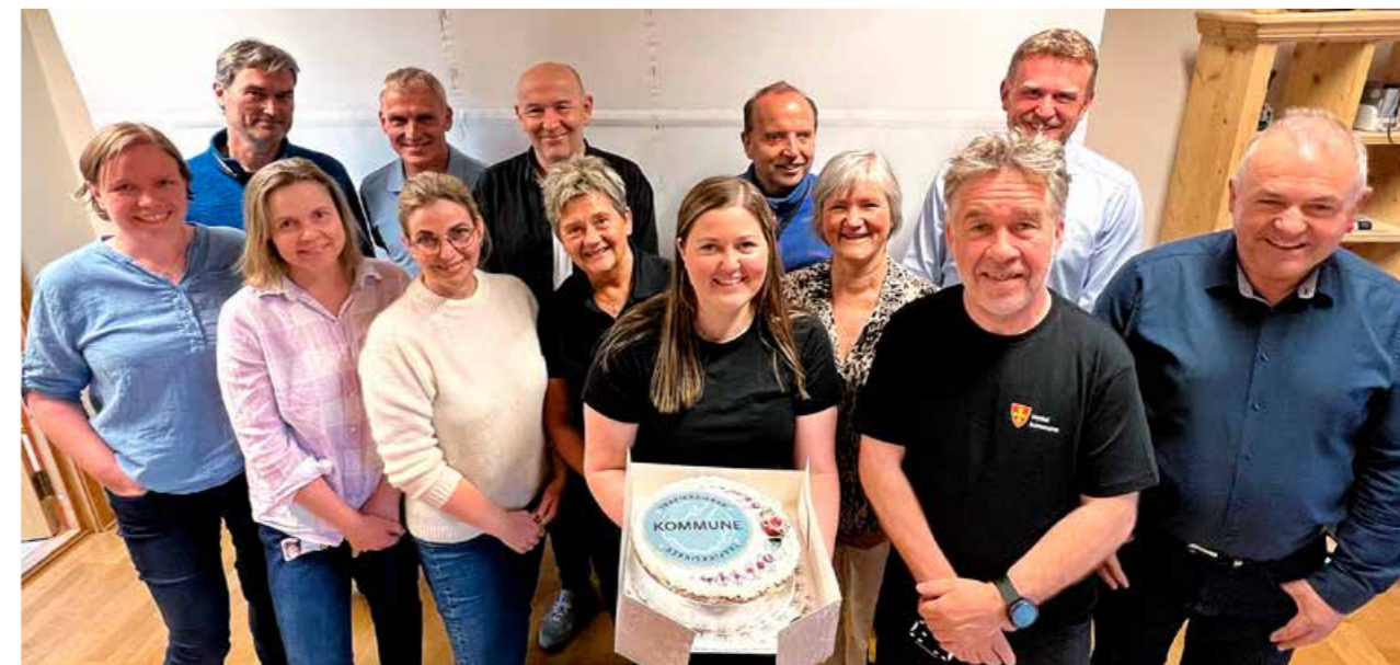
▲ Verdal kommune ble regodkjent som trafikksikker kommune etter tre år som godkjent. En regodkjenning innebærer evaluering av tiltakene i planperioden og regodkjenningsmøte med alle sektorer i kommunen.