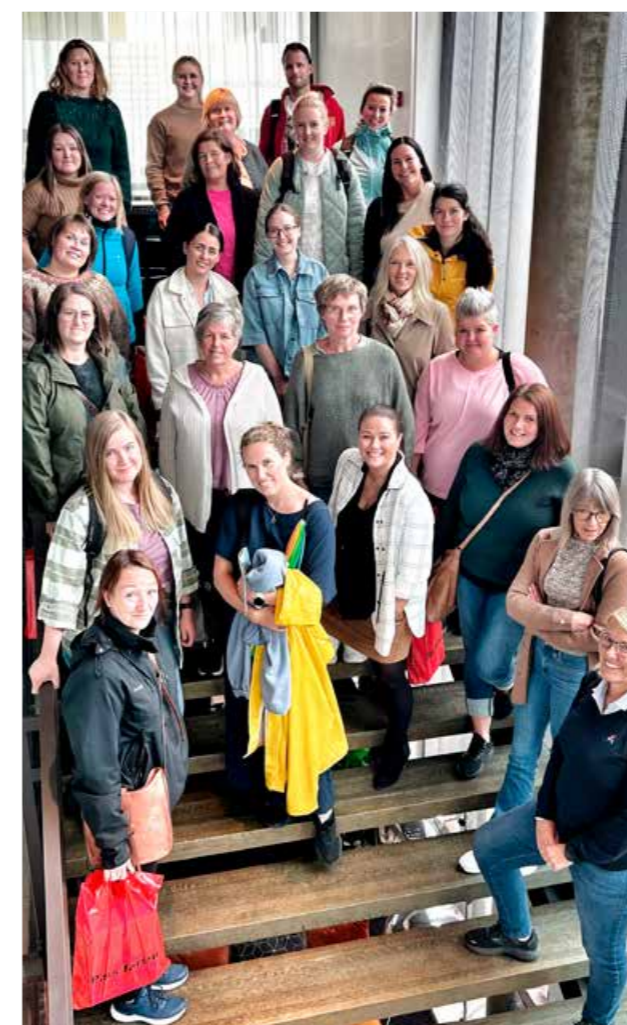
▲ En gjeng fornøyde kursdeltakere og kursholdere samlet.

barnehagens årsplaner og annet planverk. Deltakelse på disse kursene er også en fin måte å møte et av kriteriene for godkjenningsordningen Trafikksikker barnehage på.