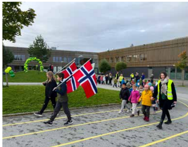
▲ Her er det åpning av hjertesonen ved Verdalsøra barne- og ungdomsskole. Det ble markert med stort oppmøte av både ordfører, ansatte og elever.