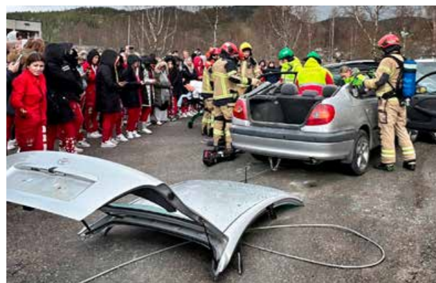
▲ Øvelse i forbindelse med forebyggingsdag.

Avgangselever er en viktig gruppe for oss. Forebygging betyr å ta gode valg på alle arenaer i livet, ikke bare i trafikken. Derfor involverer vi bredt ved gjennomføring av disse dagene. Politiet, Nok., brannvesen, ambulansetjenesten, Trygg Trafikk med flere bidrar.