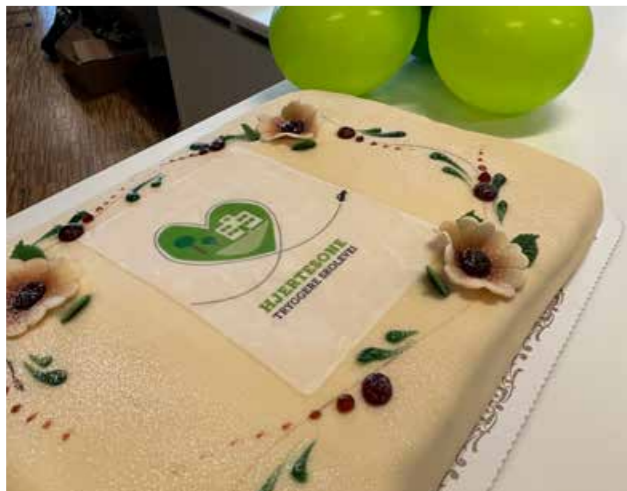
▲ Hjertesonearbeid er en arbeidsmåte der skoler og barnehager setter søkelys på trafikksikker atferd rundt sin skole og barnehage samt et bilfritt nærmiljø.